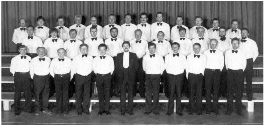
Konzertabende wurden gegeben. Im Bild in der Gemeinschaft mit Hochdorf.