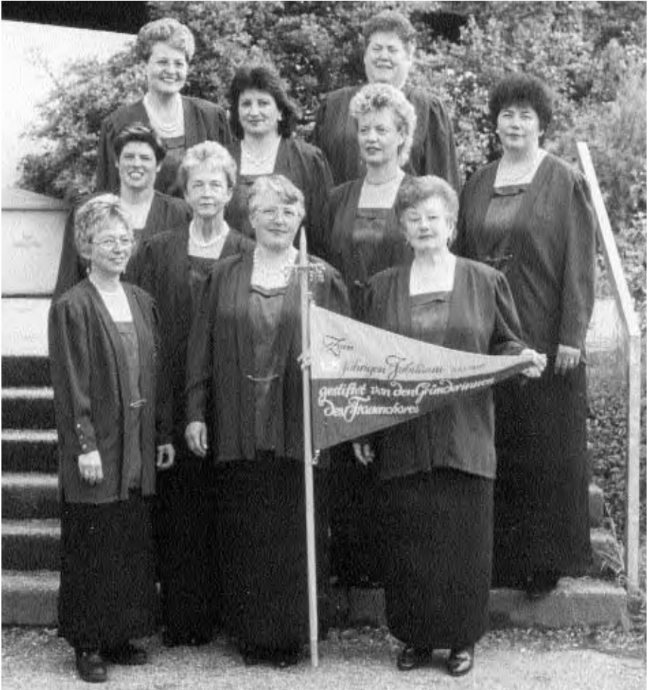
Die Mitglieder des 1996 gegründeten Frauenchores stiften zum 125jährigen Jubiläum des Sängerbundes Riet einen Wimpel.