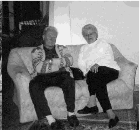
Ruhe und Erholung.

Wir sind eine Gemeinschaft mit vielen unterschiedlichen Interessen. In unserer Gemeinschaft kann man auch im hohen Alter dabei sein. Der Gesangsverein hat viele Möglichkeiten wie man sehen kann. Es ist der Mensch der den Menschen braucht, der Verein ist hierfür geschaffen.