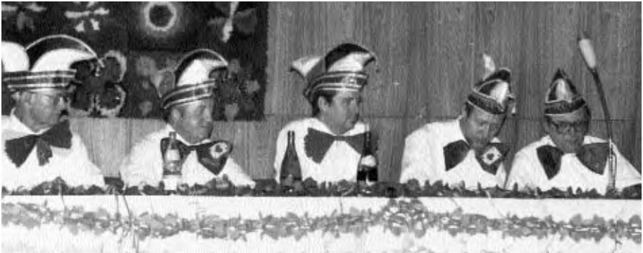
Ein Elferrat berwachte die Veranstaltung.