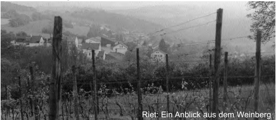
Riet: Ein Anblick aus dem Weinberg