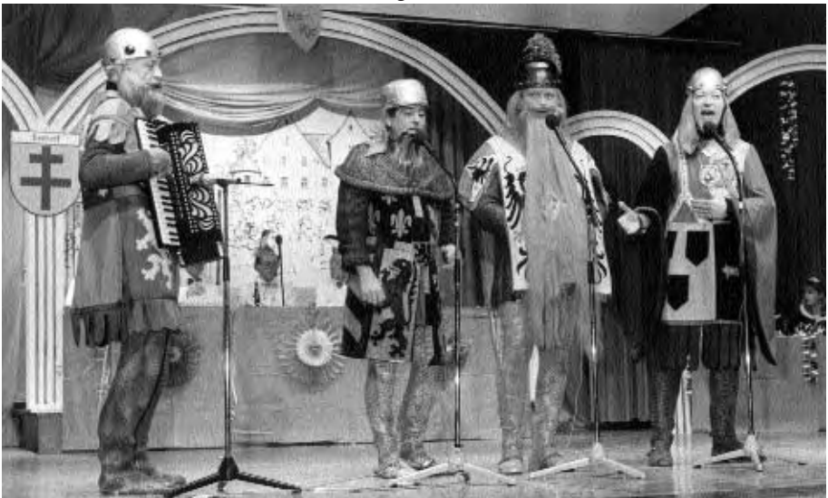
Die tollsten Verkleidungen wurden eingesetzt.