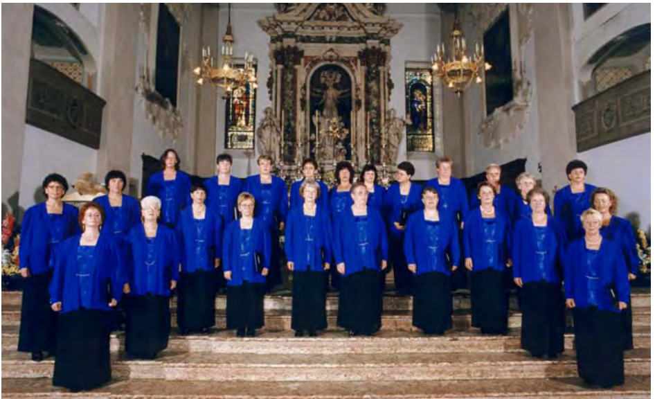
Der Frauenchor: Riva del Garda 1997 / Arco.