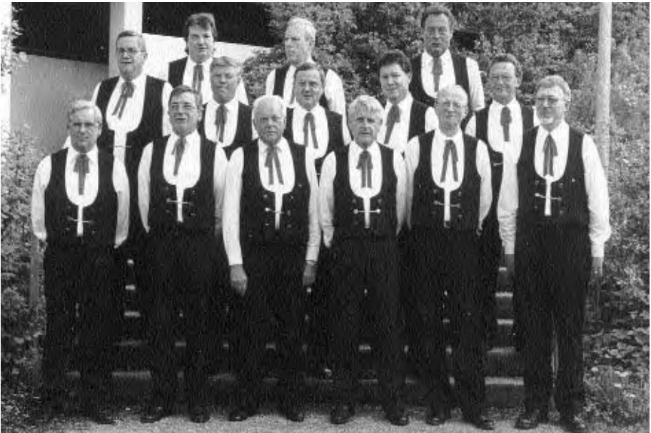
Das Erscheinungsbild des Männerchor ist in schwarzer Hose und Weste, weißes Hemd und rosafarbenen Bändel. Im Sommer tragen wir als Oberteil ein dunkelrotes Kurzarmhemd.