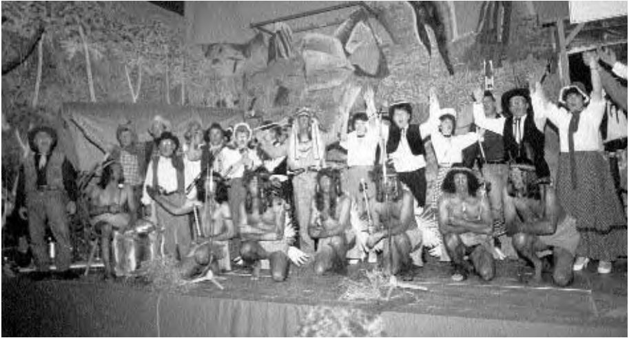
Einen Westernabend hatte man gestaltet.