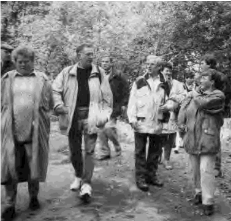
Wanderung und Unterhaltung in der Gemeinschaft.

Die Mimik eines Chorleiter ist so vielseitig, daß es eigentlich schade ist, daß dieser dem Publikum den Rücken zu wenden muß.