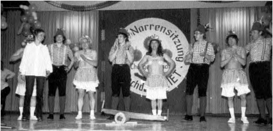
Der Sangerbund hat auch an Fasenacht das Publikum begeistert.