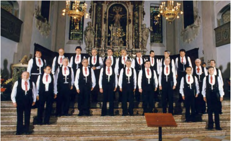
Der Männerchor: Riva del Garda 1997 / Arco.