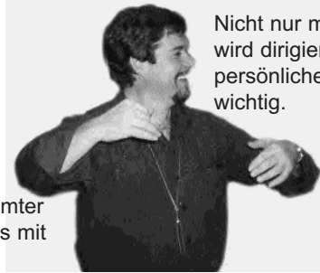
Nicht nur mit den Händen wird dirigiert, sondern der persönliche Ausdruck ist wichtig.

Die Mimik eines Chorleiter ist so vielseitig, daß es eigentlich schade ist, daß dieser dem Publikum den Rücken zu wenden muß.