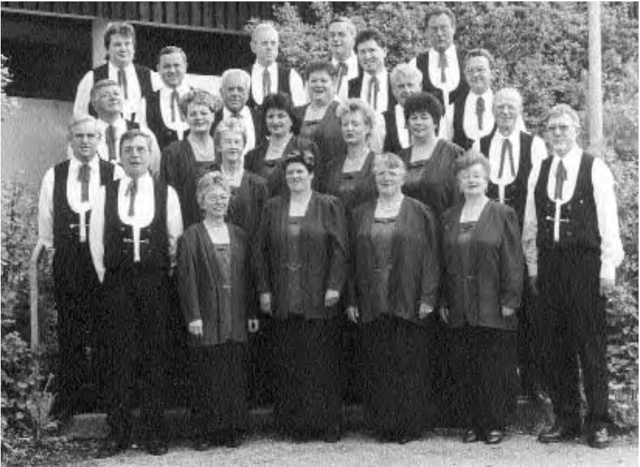
Aufnahme des gemischten Chor.