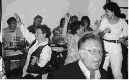
Schon sind alle dabei und singen mit!