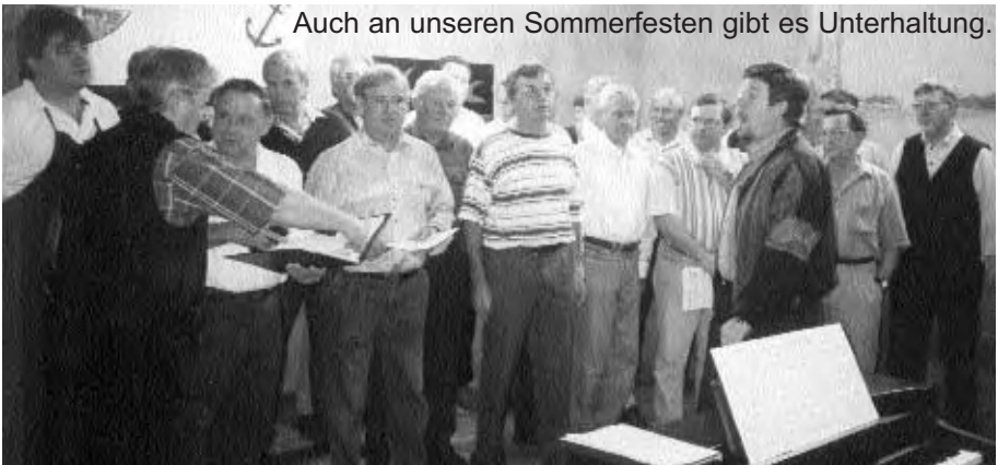
⚓ Auch an unseren Sommerfesten gibt es Unterhaltung.