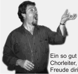
Ein so gut gestimmter Chorleiter, der uns mit Freude dirigiert!